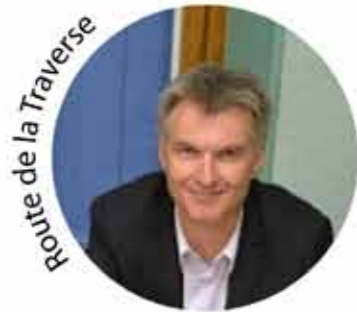
Route de la Traverse