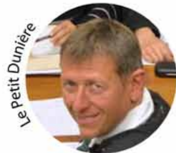
Le Petit Dunière