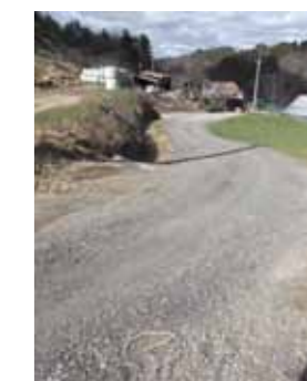
Après les travaux