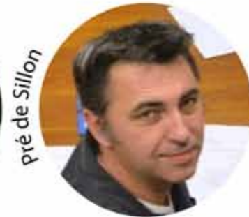
pré de Sillon