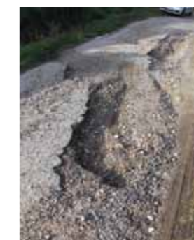
Avant les travaux

Une consultation pour la réalisation du bicouche est en cours. Les travaux de finition seront programmés courant juin.